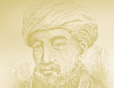
Le Beth Loubavitch

est heureux de vous inviter à la grande soirée du